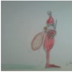
23. Türchen - Tropische Weihnacht