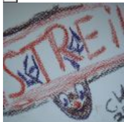
2. Türchen - Der verzweifelte Weihnachtsmann - Tropische Weihnacht