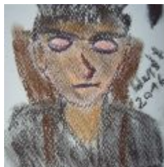
22. Türchen - Die Weihnachtsbaumsäge