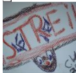
2. Türchen - Der verzweifelte Weihnachtsmann - Tropische Weihnacht