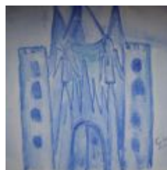
1. Türchen – Das