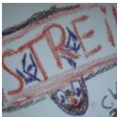
2. Türchen - Der verzweifelte