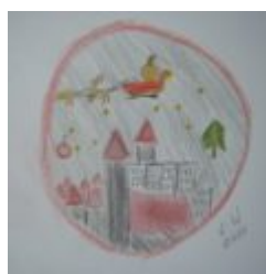
8. Türchen - Die Angst und