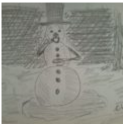
20. Türchen - Der Schneemann