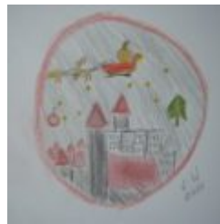
8. Türchen - Die Angst und